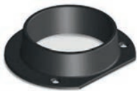
для W1-W12 (ø100 мм)

Патрубок для подключения подачи воздуха снаружи